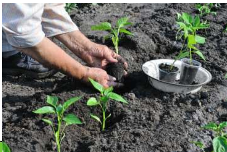
Схема посадки (80+40) X (30–35см)